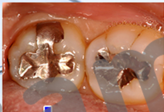
昔つめた銀のつめもの